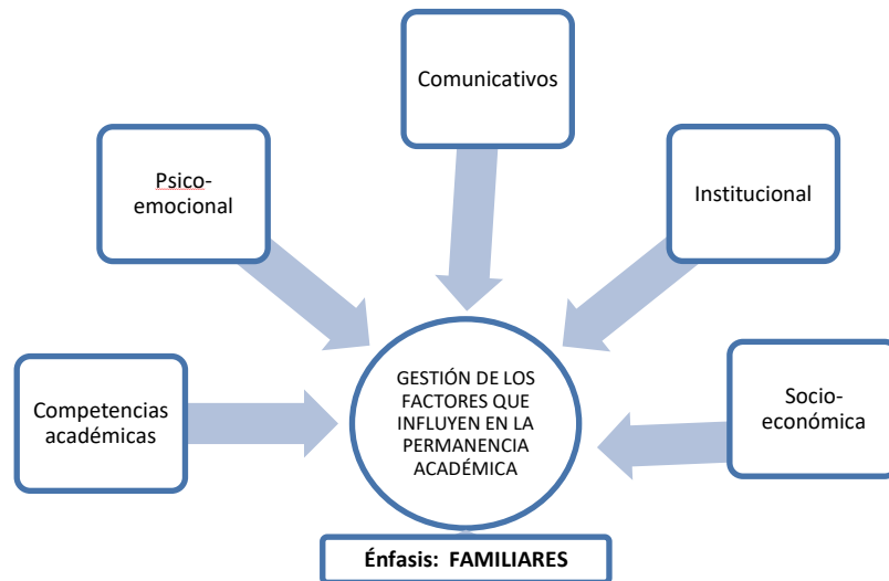
Figura 1. Énfasis en la importancia de la permanencia académica en Venezuela

coincide con el planteamiento de (Infante y Padilla, 2020), quienes establecen que la familia aporta el apoyo socio-afectivo y cognitivo que requiere el adolescente para lograr su permanencia escolar. (Figura.1).